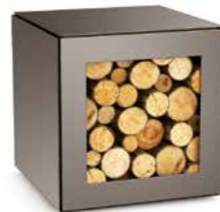
Range bûches 50 x 50 x 50 cm