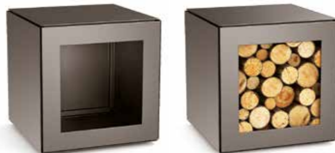
Rangement 50 x 50 x 50 cm

Une box de rangement a été spécialement optimisée pour le stockage du bois de chauffe. Utilisée en tabouret agrémenté d'un coussin ou comme étagère ou bibliothèque dans une composition de plusieurs modules, cette box peut également accueillir vos livres et vos objets préférés.